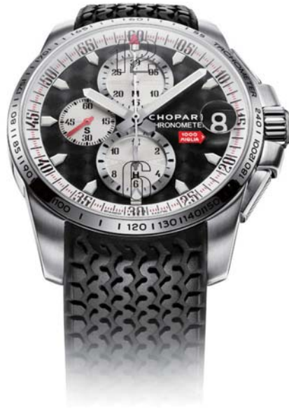
▼ Chopard Mille Miglia GT XL Chrono