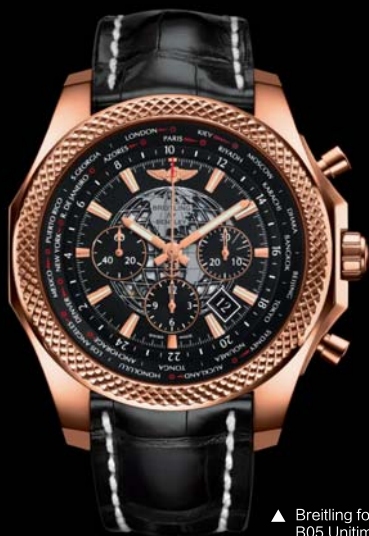
▲ Breitling for Bentley B05 Unitime