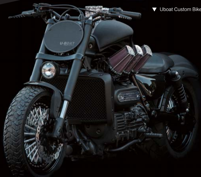
▼ Uboat Custom Bike