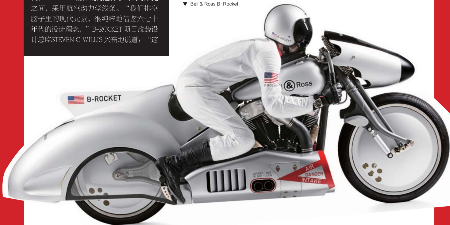
▼ Bell & Ross B-Rocket

采用尖端技术结合怀旧美感是复古的一个趋势。当职业明星驾驭这类坐骑环游各地，改装文化与腕表主题的巧妙嫁接给铁粉们带来新的玩法，速度与時計的搭配法则将会再度进化。