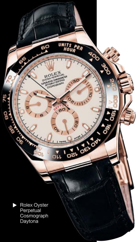
► Rolex Oyster Perpetual Cosmograph Daytona