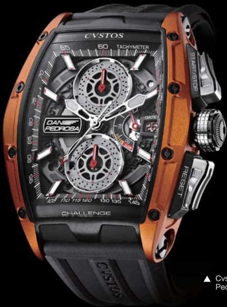
▲ Cvstos Challenge Dani Pedrosa

想随时点燃炫酷？你不用成为专业车手。那些与顶级车商合作的時計就能让你瞬间拥有手腕上的魔力。近几年帝舵表就与杜卡迪玩得热火，广受追捧的FASTRIDER（快骑手）腕表系列便是这家意大利摩托厂商最成功的诠释者。而像百年灵与宾利、积家与阿斯顿马丁这类合作关系，一直都被市场推崇。积家的腕表甚至能够直接用来开启阿斯顿马丁跑车车门。无论是飞驰在林荫大道上，还是在弯曲盘旋的小路间酷玩甩尾，你手上的精密時計就是激情燃烧的“刻度表”——它的性能越显锐利，你的“酷”指数就越加疯狂。