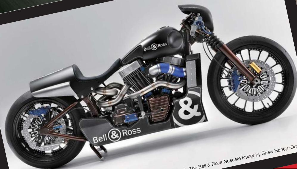
▲ The Bell & Ross Nescafe Racer by Shaw Harley-Davidson

现下，摩托虽然还是不少人的耍酷首选，但全球财富的剧烈膨胀早已将顶级跑车推入常人眼帘，那股在昔日街头似乎只属于摩托的热烈噪声，如今已被跑车更为夸张的轰鸣抢走不少风头。摩托，渐渐长出了复古的格调，温馨而且神秘。