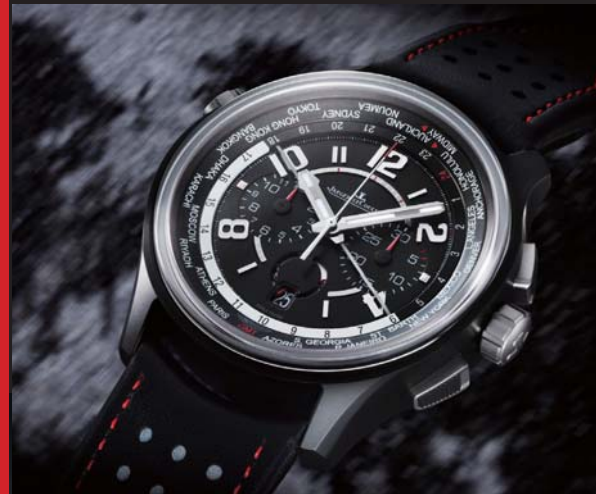
▲ Jaeger-LeCoultre AMVOX5 World Chronograph & Aston Martin ONE-77