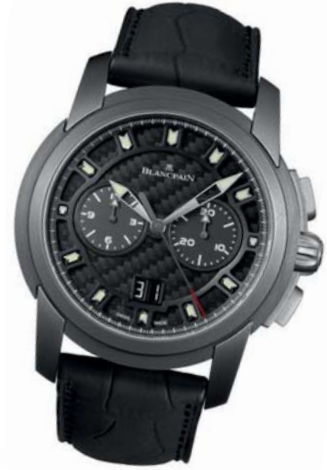
▲ Blancpain L-Evolution

想随时点燃炫酷？你不用成为专业车手。那些与顶级车商合作的時計就能让你瞬间拥有手腕上的魔力。近几年帝舵表就与杜卡迪玩得热火，广受追捧的FASTRIDER（快骑手）腕表系列便是这家意大利摩托厂商最成功的诠释者。而像百年灵与宾利、积家与阿斯顿马丁这类合作关系，一直都被市场推崇。积家的腕表甚至能够直接用来开启阿斯顿马丁跑车车门。无论是飞驰在林荫大道上，还是在弯曲盘旋的小路间酷玩甩尾，你手上的精密時計就是激情燃烧的“刻度表”——它的性能越显锐利，你的“酷”指数就越加疯狂。