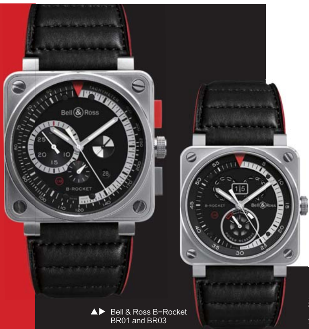
▲► Bell & Ross B-Rocket BR01 and BR03