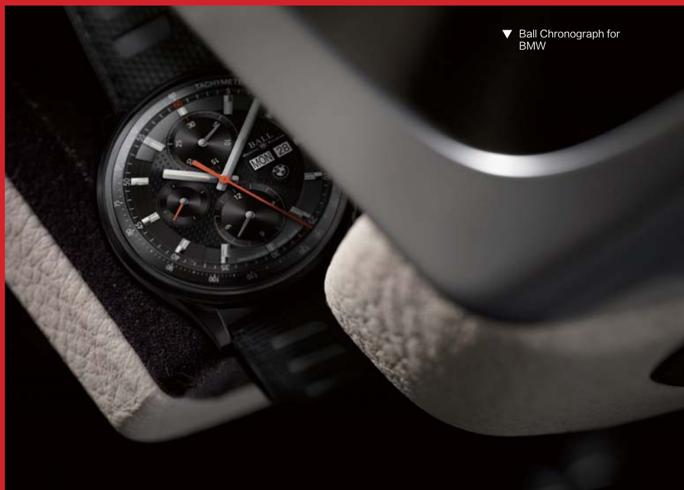
▼ Ball Chronograph for BMW