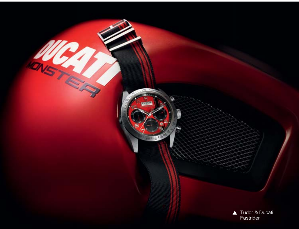
▲ Tudor & Ducati Fastrider