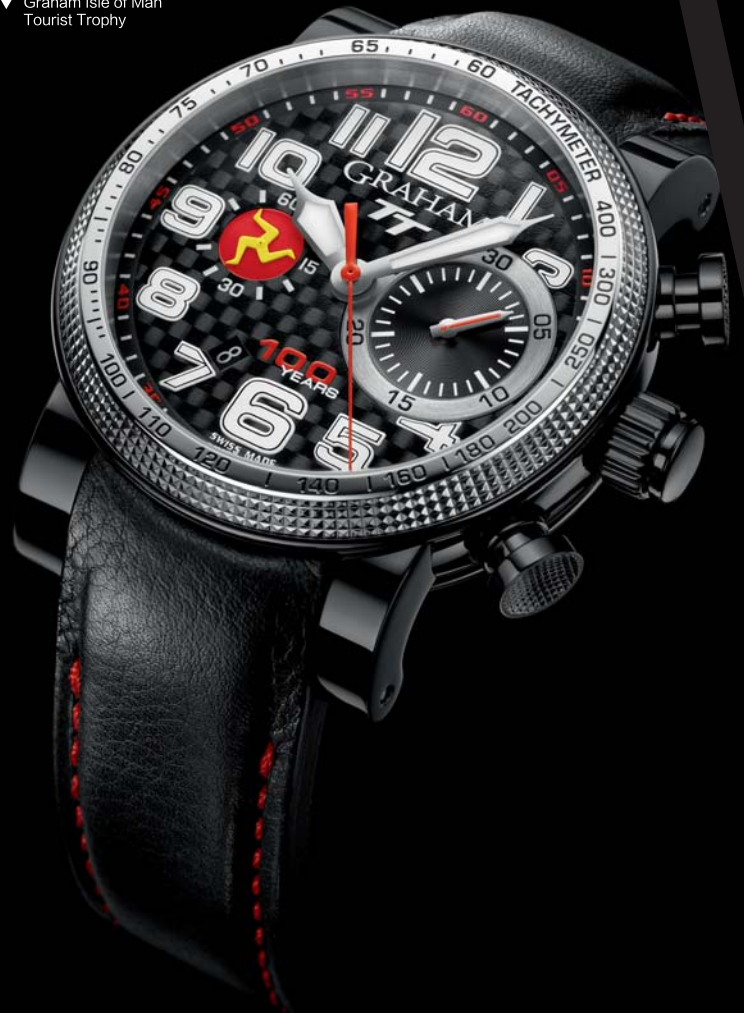
▼ Graham Isle of Man Tourist Trophy