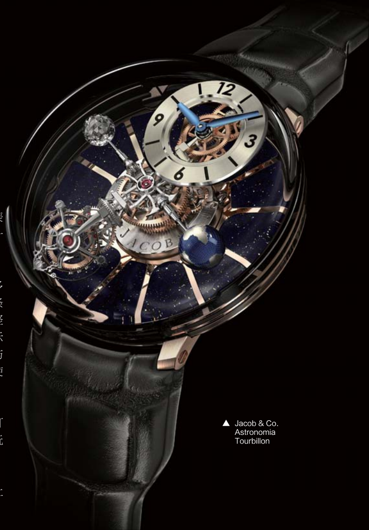
▲ Jacob & Co. Astronomia Tourbillon